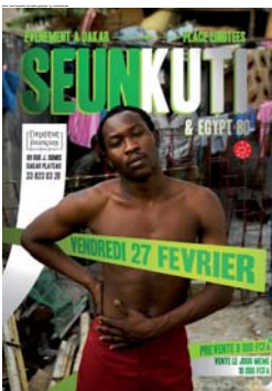
concert de Seun Kuti février 2009 Théâtre de Verdure