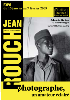
exposition Jean Rouch janvier-février 2009 galerie le Manège