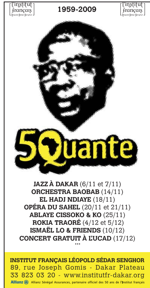
cinquantième de l'Institut novembre – décembre 2009