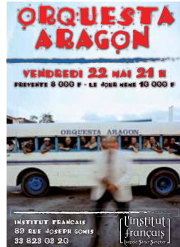
concert d' Orquesta Aragón mai 2009 Théâtre de Verdure